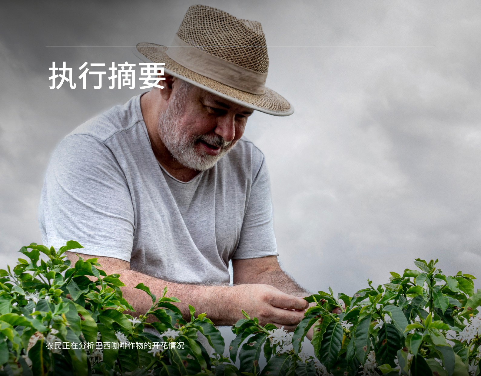
农民正在分析巴西咖啡作物的开花情况

据联合国粮农组织 (FAO) 估计,2020年全球食物贸易总额达1.53万亿美元,是二十年前的两倍多。 1 食物贸易对于满足全球不断发展的城市 and 食物不安全国家的需求至关重要,并为食物出口国提供了大量的就业机会和收入来源。随着气候变化的持续,食物断供的现象更加频繁,以及越来越多的人依赖进口,贸易的重要性会进一步上升。这方面的早期迹象已十分明显。仅2021年,在有人类居住的大陆上发生的旱灾就导致全球食物价格上涨了三分之一以上,且这一上升趋势在新冠疫情爆发前就已开始。 2,3